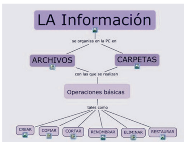
Figura 2. Ejemplo de una de los mapas conceptuales