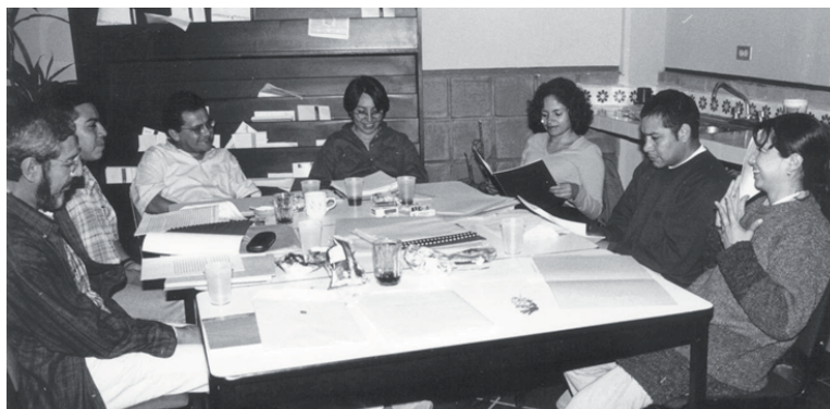
Reunión de trabajo de los integrantes del SEMV (Téllez, 2000).

El seminario se dio a la tarea de des-esencializar prácticas y discursos del campo educativo, estableciendo relaciones entre instituciones y entidades educativas, realizando programas educativos flexibles con enfoque multi e intercultural, implementando una propuesta curricular transversal, para transformar la docencia y el currículum y para fortalecer el trabajo colaborativo (Castro, 2007, pp. 34-36). A través de la implementación de estrategias de trabajo cooperativo, el SEMV consideraba viable aproximarse al campo emergente de la educación multi e intercultural, promoviendo así el trabajo conjunto para afrontar problemas locales, regionales y nacionales relacionados con la diversidad cultural, hasta entonces desatendida en el ámbito educativo.