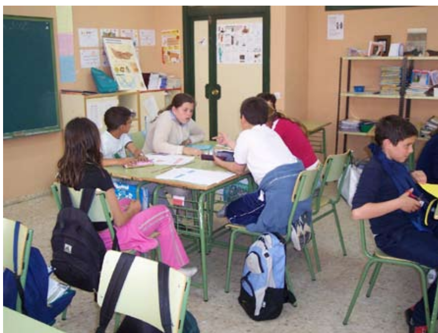
Foto 4. Alumnado trabajando de forma cooperativa