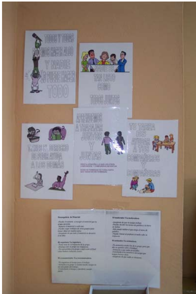
Foto 3. Los slogans elaborados por el alumnado en la pared de clase