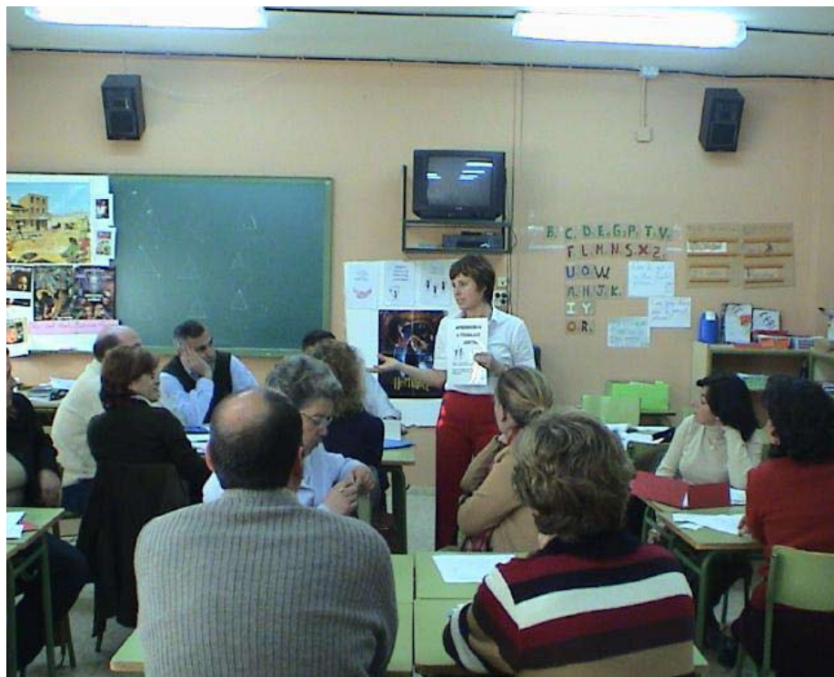
Foto 1. Sesión formativa impartida por teacher trainers a profesorado en España

• Profesorado . Esta figura ha sido la encargada en última instancia de desarrollar cada una de las actividades en las aulas. El número de profesores que recibió el primer año formación en materia de aprendizaje cooperativo y educación intercultural, fue un total de 22 profesores y profesoras, repartidos entre los cuatro colegios de las tres localidades onubenses Almonte, Bonares y Moguer. Sin embargo, el último año de proyecto, aun cuando el profesorado ha continuado recibiendo las unidades CLIM para ser realizadas en sus aulas, el número de profesores y profesoras