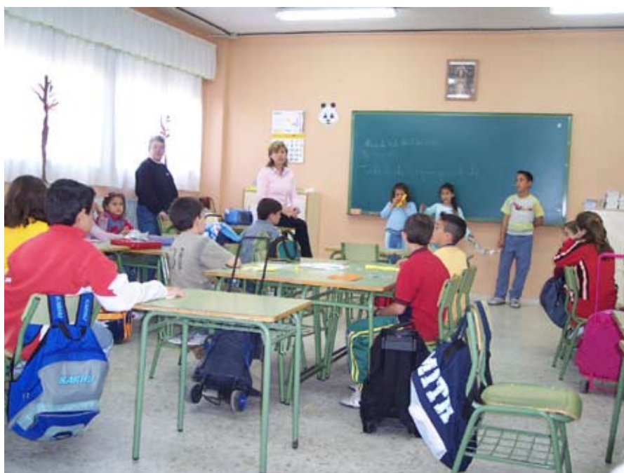
Foto 2: Desarrollo de la unidad 3 en un aula. Apoyo de teacher trainer dentro del aula

En este colegio la metodología de aprendizaje cooperativo y educación intercultural no ha sido una experiencia aislada y anecdótica en el tiempo, sino que ha calado en la planificación, organización e ideario del centro. Algunos datos que muestran esta situación han sido: