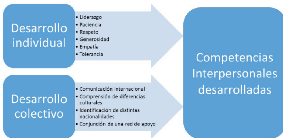
Figura 2. Teoría del desarrollo de competencias interpersonales en ambientes virtuales de aprendizaje

Los elementos relacionados con el desarrollo individual y colectivo de la teoría del desarrollo de competencias interpersonales, son presentados en la Figura 2 para su observación gráfica.