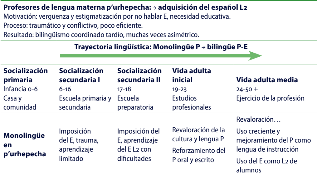
Tabla 3. Del español al p'urhepecha. Trayectoria lingüística de maestras y maestros entrevistados