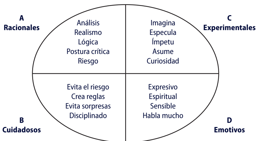
Esquema 1. Modelo de Ned Herrmann